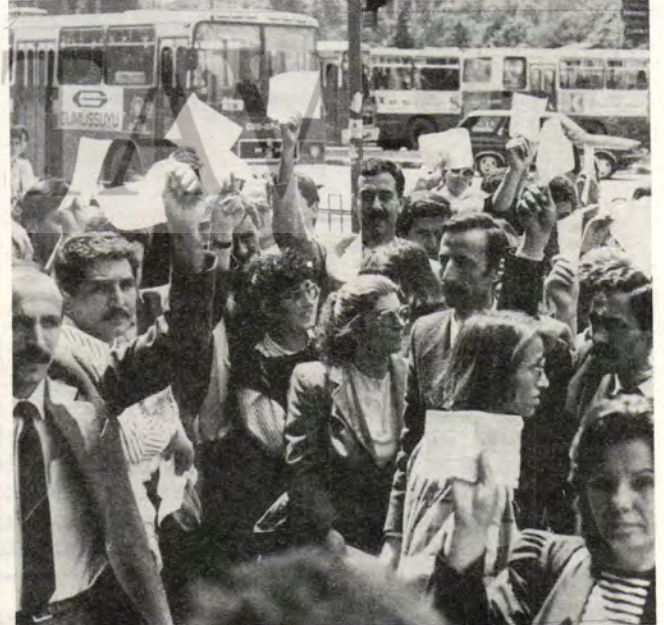
Ankara: 4 Mayıs 1989... Sefalet bordroları havalarda...