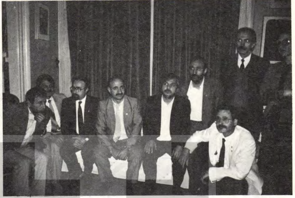
Genel Yönetim Kurulu üyeleri toplu halde...

BANKS GÜNEY BÖLGE TEMSİLCİLİĞİ: Karasokulu Mah. 102 Sok. No: 27 Baykam İşhanı ADANA Tel: 12 05 48