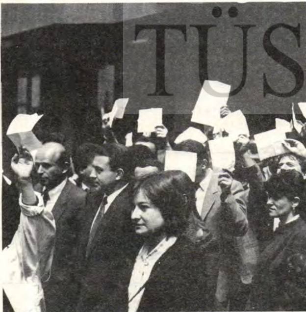
İstanbul 4 Mayıs 1989 Genel Müdürlük önü: Sefalet Bordroları yakılıyor...

HAKETTİĞİMİZ BİR ÜCRET, YANİ GERÇEK YAŞAMIN TEMEL ALINDIĞI GEREKSİNİMLERİ KARŞILAYACAK BİR ÜCRET..